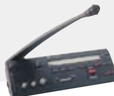
Pulpit tłumacza DCN