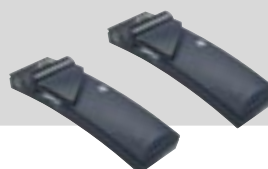
Odbiornik podczerwieni INTEGRUS