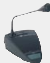
Pulpit dyskusyjny DCN