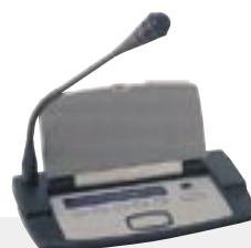
Pulpit konferencyjny DCN

System Integrus firmy Bosch jest kompatybilny z innymi seriami produktów Bosch przeznaczonymi do wspomagania dyskusji, prezentacji, podejmowania decyzji i dystrybucji informacji. System DCN (Digital Congress Network – Cyfrowa sieć kongresowa) jest doskonałym rozwiązaniem, począwszy od zarządzania małymi spotkaniami, aż po wielkie międzynarodowe kongresy z tysiącami uczestników. Urządzenia dyskusyjne DCN oferują tę samą jakość, lecz są zoptymalizowane do zastosowań przy spotkaniach i dyskusjach w niewielkim gronie. System CCS 800 jest wszechstronnym i ekonomicznym rozwiązaniem przeznaczonym dla małych i średniej wielkości konferencji i spotkań.